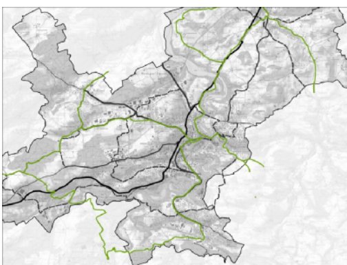
Auszug aus dem Velowegnetz des Langsamverkehrskonzepts der Agglomeration Freiburg

Ein Velowegnetz mit durchgängigen Routen anzustreben, bedeutet, fehlende Verbindungen zu identifizieren, die Sicherheit jedes Abschnitts zu gewährleisten, neue Wege zu entwerfen und die Überwindung topografischer und infrastruktureller Hindernisse (Fluss, Eisenbahnlinie usw.) zu lösen. Durch die Konkretisierung sollen die Velowege mithilfe entsprechender Infrastrukturen intuitiv und leicht verstanden und damit befahren werden können. Der Plan des Velowegnetzes verleiht dem Velo einen offiziellen Platz in der Verkehrsplanung einer Gemeinde oder Region.