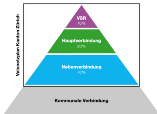
Hiérarchie du réseau cyclable cantonal à Zurich