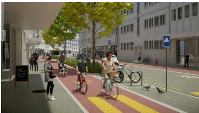
Illustration de pistes cyclables sûres et attrayantes en ville.