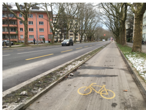
Piste cyclable unidirectionnelle avec séparation du trafic le long de la Winkelriedstrasse, Berne