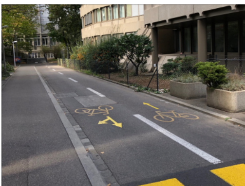
Piste cyclable bidirectionnelle dans une rue fermée au trafic motorisé à Bâle

Le gabarit de la piste doit permettre la cohabitation et le dépassement entre les différents types de vélos (vélos à assistance électrique, vélos cargos, remorques, etc.). L'interdiction de stationner sur les pistes cyclables par des voitures ou camions (livraisons p.ex.) doit également être respectée. Les pistes cyclables bidirectionnelles posent des défis supplémentaires, notamment en milieu construit et au niveau des nœuds d'intermodalité.