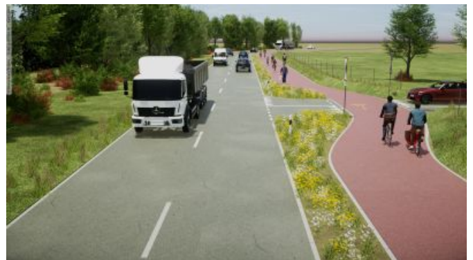
Illustration de pistes cyclables sûres et attrayantes sur les axes principaux hors des villes.