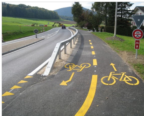
Piste cyclable bidirectionnelle le long de la route cantonale entre Courchapoix et Vicques.