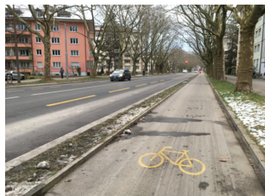
Piste cyclable unidirectionnelle avec séparation du trafic le long de la Winkelriedstrasse, Berne