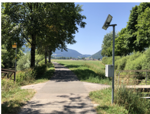
Chemin agricole dans le Val de Travers sur un itinéraire SuisseMobile avec poste de comptage vélos

La présence de véhicules agricoles pose un enjeu de sécurité pour les cyclistes. Ces derniers doivent parfois ralentir ou s'arrêter sur le bas-côté en cas de croisement. L'enjeu de cohabitation concerne également les promeneurs et les randonneurs équestres. L'utilité première des chemins agricoles ne leur confère pas forcément un grand intérêt en termes de connectivité et leur tracé peut présenter de nombreux détours. L'entretien régulier de ces chemins – souvent souillés par les activités agricoles – est un enjeu essentiel et doit être réglé entre les différents acteurs et actrices (autorités, personnes agricoles). Il est recommandé de négocier le droit de passage avec les propriétaires fonciers afin de pérenniser l'itinéraire. Finalement, l'intérêt de ces tracés est limité selon la saison, notamment en raison de l'absence d'éclairage, d'évacuation des eaux (flaques et verglas) et de déneigement.