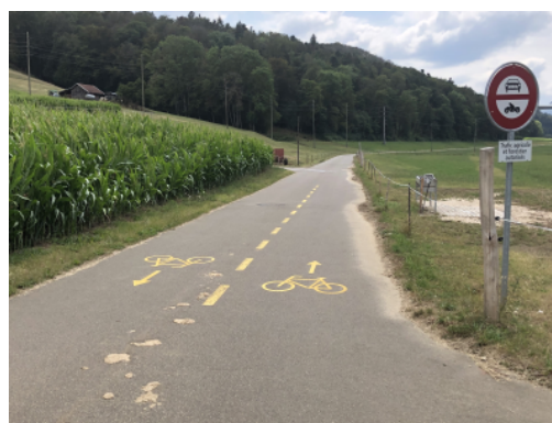
Chemin agricole avec pictogrammes vélos à Courtedoux dans le canton du Jura