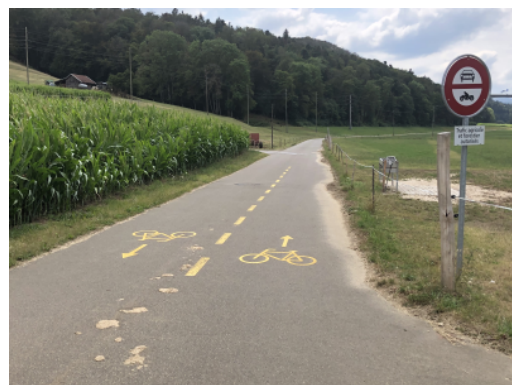
Chemin agricole avec pictogrammes vélos à Courtedoux dans le canton du Jura