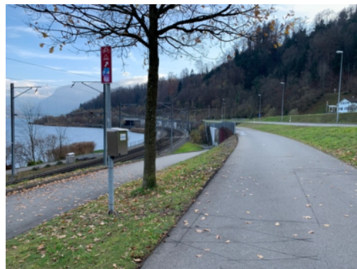
Point de comptage avec boîtier suspendu à Horw, Lucerne.

Au-delà des compteurs "officiels", des associations ou des particuliers procèdent à des comptages manuels ou utilisent des compteurs simples d'utilisations tels que Telraam .