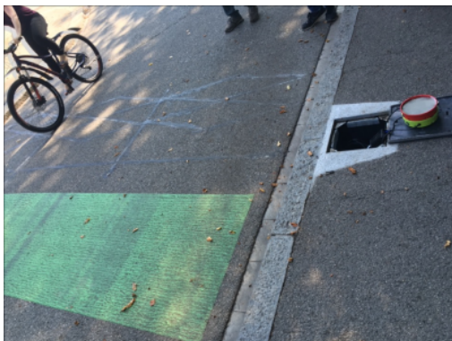
Point de comptage avec boîtier enterré à Dreibeinskreuzstrasse à Soleure

Evolution annuelle moyenne du trafic cycliste aux postes de comptage en milieu rural et urbain, 2010-2023. (source: Schweizer et Lindenmann, 2024)