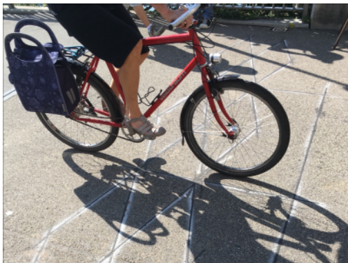
Point de comptage au pont Kreuzackerbrücke à Soleure

Compter un vélo reste plus compliqué que de compter une voiture en raison de sa plus faible empreinte. Les données de comptages sont parfois corrigées pour tenir compte des pannes, des erreurs ou de la météo.