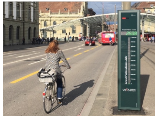
Totem de comptage à Bubenberplatz à Berne

La Fondation SuisseMobile analyse depuis 2016 la fréquentation des itinéraires de "La Suisse à vélo" destinés avant tout au vélo de loisir. Entre 2018 et 2023, l'Observatoire universitaire du vélo et des mobilités actives (OUVEMA) a analysé, sur mandat de l'OFROU, les comptages automatiques dans les agglomérations et portant surtout sur les usages utilitaires.