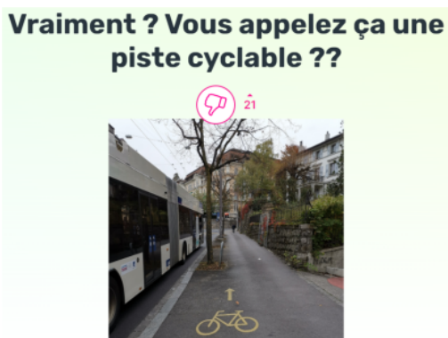
Beispiel für einen identifizierten Problempunkt, Lausanne.

Die Plattform Bicycle user experience listet Methoden auf (User Experience Mapping, Storytelling, vergleichende Analysen und andere), um die Erfahrungen von Velofahrenden zu thematisieren, Problemstellen zu identifizieren, etc.