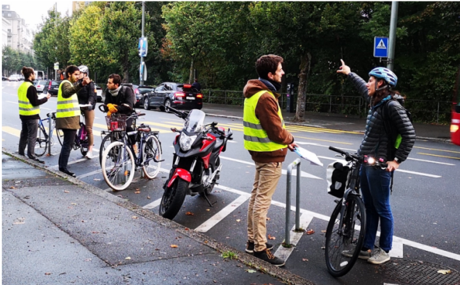
Vom OUVEMA im Rahmen der Evaluation einer Veloverkehrsanlage durchgeführte Intercept surveys auf dem Boulevard de Pérolles, Freiburg (Schmassmann & Rérat 2023)