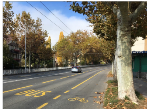
Voie de bus et bande cyclable à Nordring à Berne

Deux modèles d'aménagement de la cohabitation bus et vélos sont possibles. Le premier propose de délimiter l'espace dédié aux cycles par une bande cyclable, renforçant ainsi la sécurité des cyclistes. Un espace suffisant est toutefois nécessaire pour réaliser cet aménagement ; au-delà de 4.2m, il devient difficile pour un bus articulé de dépasser un cycliste en sécurité (Conférence vélo suisse, 2019). Le second type d'aménagement est un aménagement mixte, où cyclistes et bus partagent le même espace routier. Davantage d'informations sont disponibles sur la fiche " Gestion des vélos aux arrêts de bus/tram ".