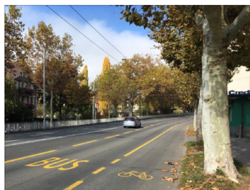
Voie de bus et bande cyclable à Nordring à Berne

Deux modèles d'aménagement de la cohabitation bus et vélos sont possibles. Le premier propose de délimiter l'espace dédié aux cycles par une bande cyclable, renforçant ainsi la sécurité des cyclistes. Un espace suffisant est toutefois nécessaire pour réaliser cet aménagement ; au-delà de 4.2m, il devient difficile pour un bus articulé de dépasser un cycliste en sécurité (Conférence vélo suisse, 2019). Le second type d'aménagement est un aménagement mixte, où cyclistes et bus partagent le même espace routier. Davantage d'informations sont disponibles sur la fiche " Gestion des vélos aux arrêts de bus/tram ".