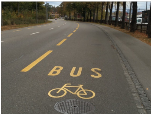
Voie de bus autorisée aux cycles à la Murtenstrasse à Berne

La cohabitation entre vélos et bus constitue le principal enjeu. Il est déconseillé d'appliquer cette mesure si le bus ne peut pas doubler le cycliste en toute sécurité (largeur de la voie permettant une distance de sécurité entre le bus et le cycliste, différentiel de vitesse permettant un dépassement rapide). La fréquence des bus et la longueur du tronçon sont également à prendre en compte. Lorsque celles-ci sont faibles, il y a moins d'enjeux de cohabitation. L'avancement du cycliste peut être gêné au droit des arrêts de bus, en particulier si ces derniers sont situés sur la chaussée et non « en baignoire » (c'est-à-dire avec un décrochement de la chaussée). La qualité du revêtement – souvent parsemé d'ornières causées par le passage fréquent des bus – peut péjorer le confort et la sécurité. Enfin, la bonne connectivité dépendra de la gestion des carrefours et des transitions (éviter et limiter les pertes de priorité, notamment en sortie de la voie de bus).