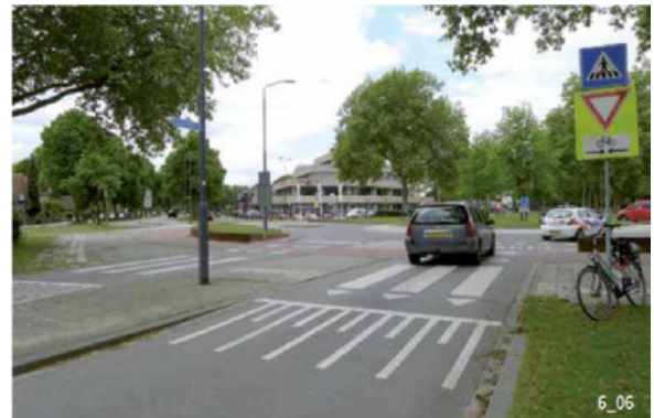
Décrochement vertical permettant d'abaisser la vitesse des automobilistes au carrefour aux Pays-Bas.