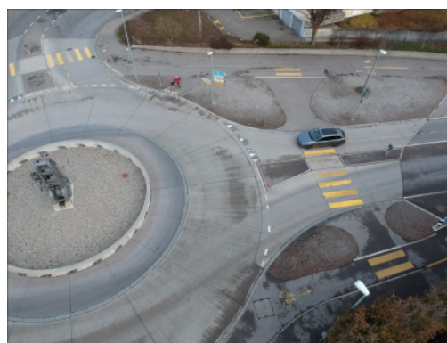
Giratoire "Schachenkreisel" avec pistes cyclables séparées à Lyss