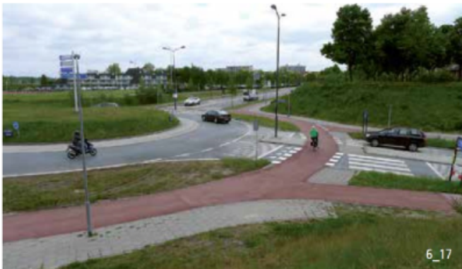
Piste cyclable séparée avec priorité lors de la traversée de la route aux Pays-Bas.