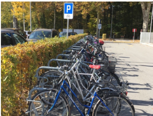
Parking vélo sur le campus vonRoll de la HEP et de l'Université de Berne

Il est également important de permettre une utilisation intuitive pour différents types de vélos (vélos à assistance électrique, vélos cargos, remorques, etc.). Le choix d'une protection contre les intempéries ou non (toiture), la durée de stationnement prévue et le nombre de places doivent être planifiés en fonction des besoins actuels mais aussi futurs, et tenir compte des normes en vigueur (notamment VSS 40 066 / 40 065). Enfin, l'entretien doit être assuré.