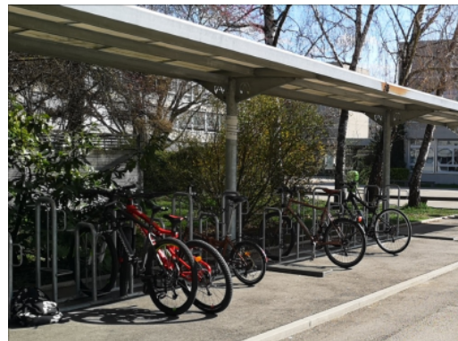
Parking vélo couvert sur le site du Centre professionnel du nord vaudois (CPNV) à Yverdon-les-Bains