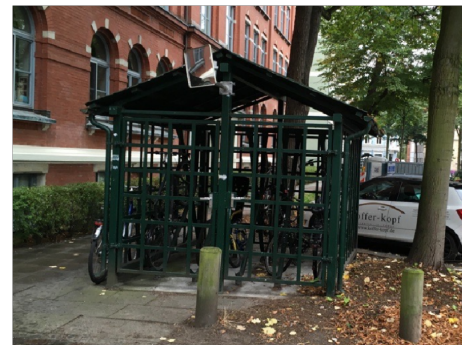
Exemple de stationnement pour vélos protégé et sécurisé dans l'espace public à Hambourg

Pour répondre à l'absence de stationnement vélo, notamment dans les immeubles anciens, la ville de Hambourg a mis en place des « Fahrradhäuschen » qui peuvent être construites dans l'espace public sur demande d'habitant-e-s ou de propriétaires et qui sont en partie subventionnés.