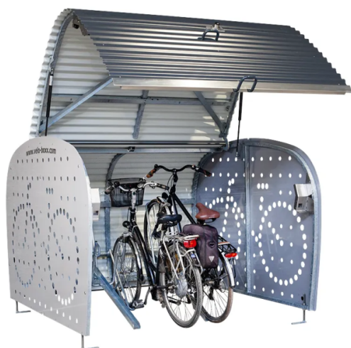
Les Velobox à Lausanne.

Exemples de supports de stationnement pour vélos recommandés.