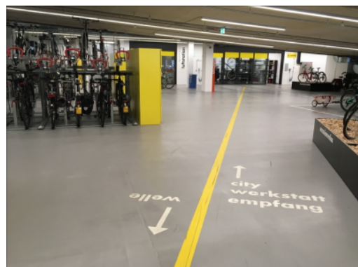
Velostation von PostParc am Bahnhof Bern