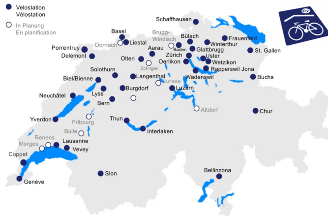
Karte mit den Standorten der Schweizer Velostationen, Stand Februar 2022.