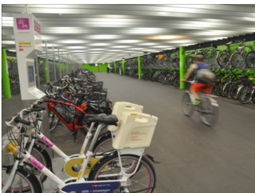
Velostation am Bahnhof Solothurn

Die Lage und der Zugang sind die wichtigsten Kriterien für die Nutzung einer Velostation. Um ihre Attraktivität zu gewährleisten, müssen bei den Zugängen (Ein- und Ausfahrten) Konflikte mit anderen Verkehrsteilnehmenden sowie Umwege vermieden werden. So wird ungewolltes Absteigen und Schieben verhindert. Es wird auch empfohlen, auf die Beschilderung der Zugänge zu achten. Wie bei Unterführungen sollten die Breite und Steigung der Zufahrtsrampe sowie ihre Beleuchtung besonders beachtet werden. Um ein Gefühl der Unsicherheit zu vermeiden, sollte die Rampe einfach und ohne Ecken und Kanten gestaltet sein.