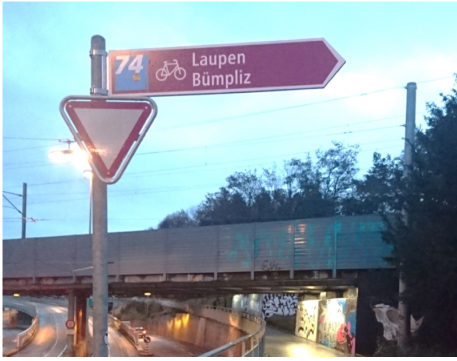
Signalétique de loisirs pour un itinéraire SuisseMobile à Berne

SuisseMobile est un réseau d'itinéraires nationaux, régionaux et locaux pour une multitude de loisirs (randonnée, vélo, VTT, roller, raquettes à neige, etc.). Un numéro est attribué à chaque itinéraire qui est balisé par des panneaux. Le site web et une application mobile permettent de planification des itinéraires personnalisés.