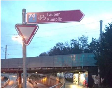
Signalétique de loisirs pour un itinéraire SuisseMobile à Berne

SuisseMobile est un réseau d'itinéraires nationaux, régionaux et locaux pour une multitude de loisirs (randonnée, vélo, VTT, roller, raquettes à neige, etc.). Un numéro est attribué à chaque itinéraire qui est balisé par des panneaux. Le site web et une application mobile permettent de planification des itinéraires personnalisés.