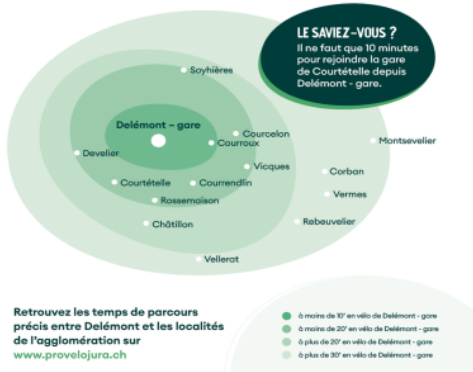
Carte des temps de parcours à vélo à partir de la gare de Delémont.