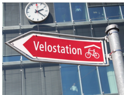
Signalétique pour la vélostation Milchgässli à Berne