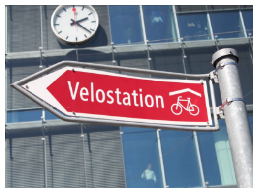
Signalétique pour la vélostation Milchgässli à Berne