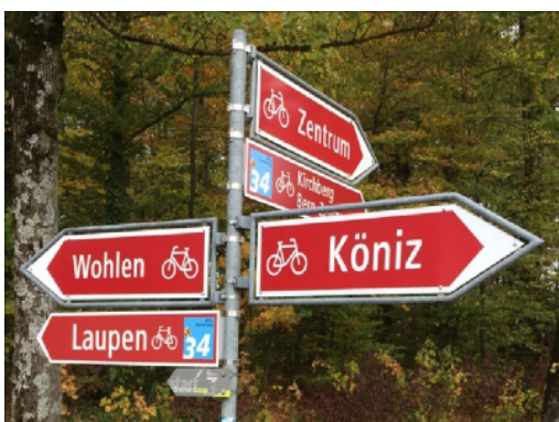
Signalétique pour loisirs pour un itinéraire SuisseMobile et signalisation pendulaire à Berne

Un enjeu principal du jalonnement cyclable consiste en sa bonne intégration dans le contexte spatial. Il s'agit notamment de veiller à la complémentarité des concepts de jalonnement (routiers, régionaux, locaux), en évitant les informations redondantes. Le juste niveau de jalonnement doit aussi être trouvé : des panneaux trop nombreux créent de la confusion, des panneaux trop rares de l'incertitude. Les lieux d'implantation doivent être choisis avec soin, principalement pour assurer leur bonne visibilité et leur caractère intuitif. La coordination entre institutions (communes, cantons) est également importante pour assurer la continuité des indications et la cohérence d'ensemble. Un autre enjeu relève de l'entretien de la signalisation (contrôle régulier et responsabilité clairement définie).