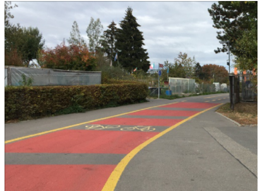
Revêtement rouge sur un espace où les piétons ne croisent une piste cyclable à Berne