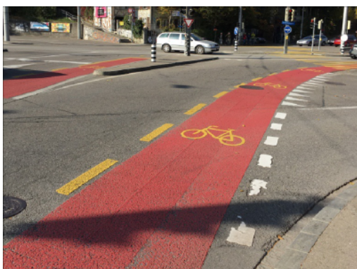
Revêtement rouge à l'intersection Henkerbrännli à Berne