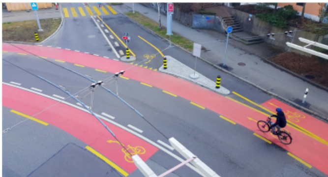
Revêtement rouge au carrefour de Bucheggplatz à Zurich