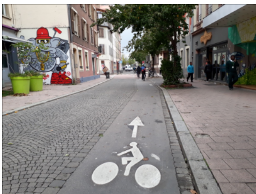
Bande goudronnée dans une rue pavée à Strasbourg

La coloration d'une surface en rouge attire l'attention des usagers et des usagères de la route sur les zones de danger, mais ne résout pas le problème de sécurité à la base. Elle ne devrait donc être utilisée que lorsqu'il n'existe pas d'autres solutions plus efficaces. En outre, y recourir trop fréquemment risque d'en banaliser l'effet. La coloration systématique des réseaux cyclables n'est pas autorisée actuellement en Suisse. L'entretien des aménagements cyclables doit être une priorité des communes, notamment en hiver (déneigement).