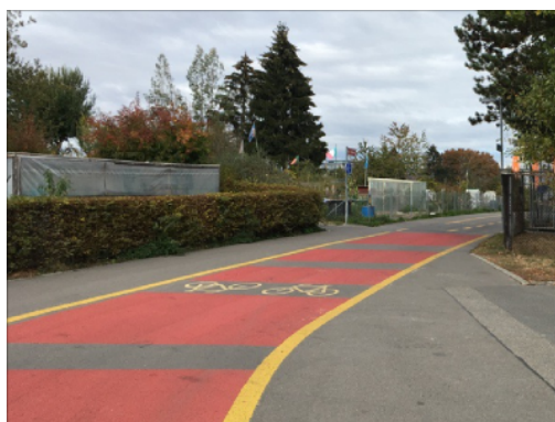
Revêtement rouge sur un espace où les piétons croisent une piste cyclable à Berne