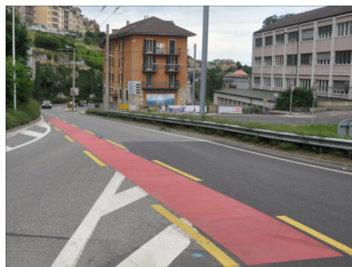
Revêtement rouge à une intersection à Neuchâtel