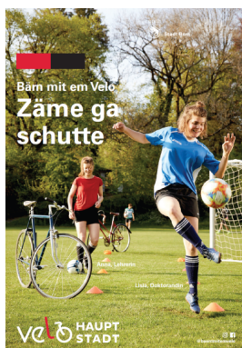
Campagne de communication de la ville de Berne

La réussite d'une campagne de communication tient à la maîtrise des outils marketing. Publics-cibles, canaux de communication et messages doivent être pensés de concert.