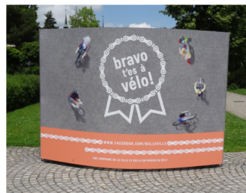
Campagne d'affichage à Bulle